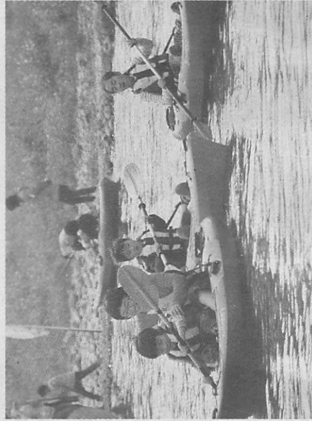
人気を集めたカヌー体験

さおを出し魚を狙った。魚つかみ取りや子ども相撲大会、カヌー体験、軽トラ市などのイベントも催された。さまざまな体験を楽しんだり、魚の塩焼きをおいしそうに食べたりする姿が見られ終始にきわっていた。